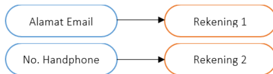
Contoh A: 1 Proxy ditautkan untuk 1 Rekening

Satu Proxy (nomor telepon selular atau alamat email) Nasabah hanya dapat ditautkan ke satu nomor rekening Bank Danamon, namun satu nomor rekening Bank Danamon dapat ditautkan ke satu atau lebih Proxy (nomor telepon selular dan alamat email) Nasabah, seperti pada contoh diagram berikut.